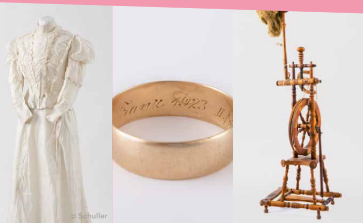
K | Kuratorin

für BesucherInnengruppen gegen Voranmeldung Preis: Eintritt + € 29,- Führungszuschlag pro geführter Gruppe